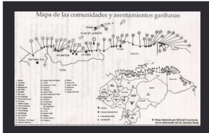
Figura 28.- Mapa de las Comunidades y Asentamientos Garífunas.